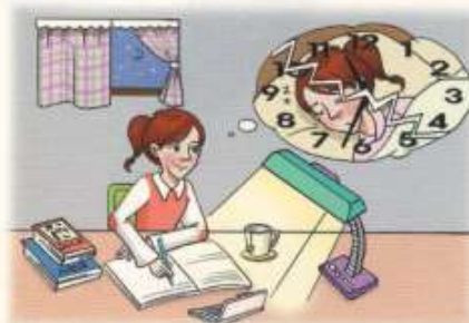
바쁜 현대인들은 항상 시간에 쫓기면서 산다.